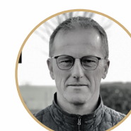
Pascal LIVENAIS URBANISME