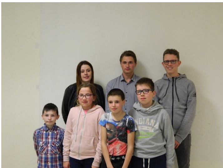
Les qualifiés de Beaulieu sur Oudon

La Finale qui a eu lieu au cinéma Le Trianon du Bourgneuf a vu la victoire du joueur du Bourgneuf suivi du candidat de La Brûlatte, Beaulieu s'octroie la troisième place du podium ! Bravo et merci à tous d'avoir participé.