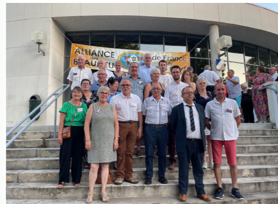
18 habitants de la Commune ont participé à ce rassemblement

Prochaine rencontre les 7 et 8 septembre 2024 à Beaulieu en Isère (38)